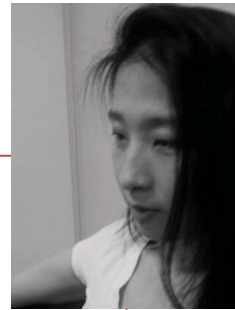
Young Kim Copy Writer

삼성전자. 아시아나항공 대상 청정원. 모토롤라. KT. 아모레퍼시픽 유한킴벌리. IBM 등 다수 캠페인